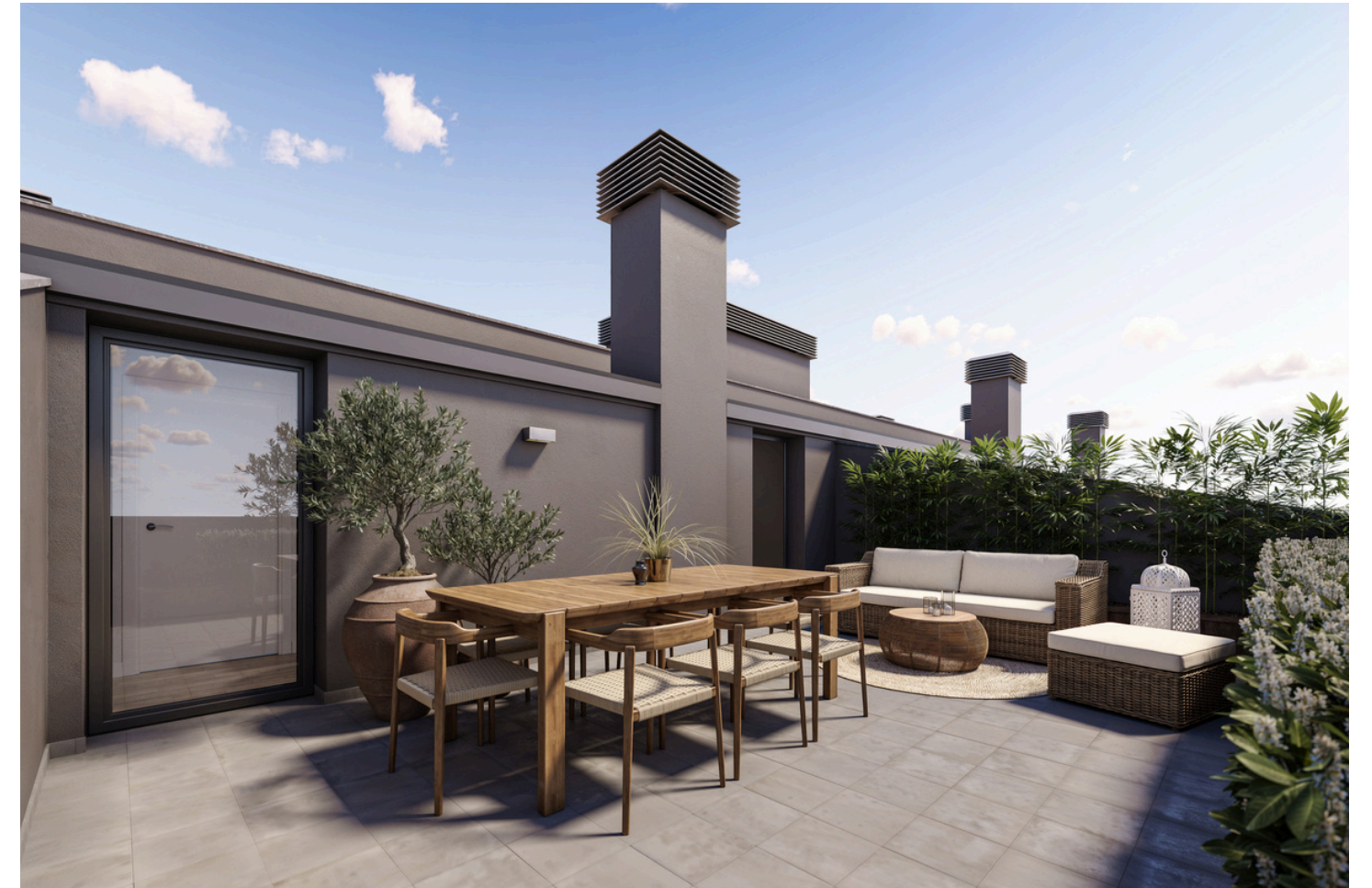
Terraza àtic dúplex

Destaquen les grans terrasses dels habitatges en planta baixa i dels àtics dúplexs