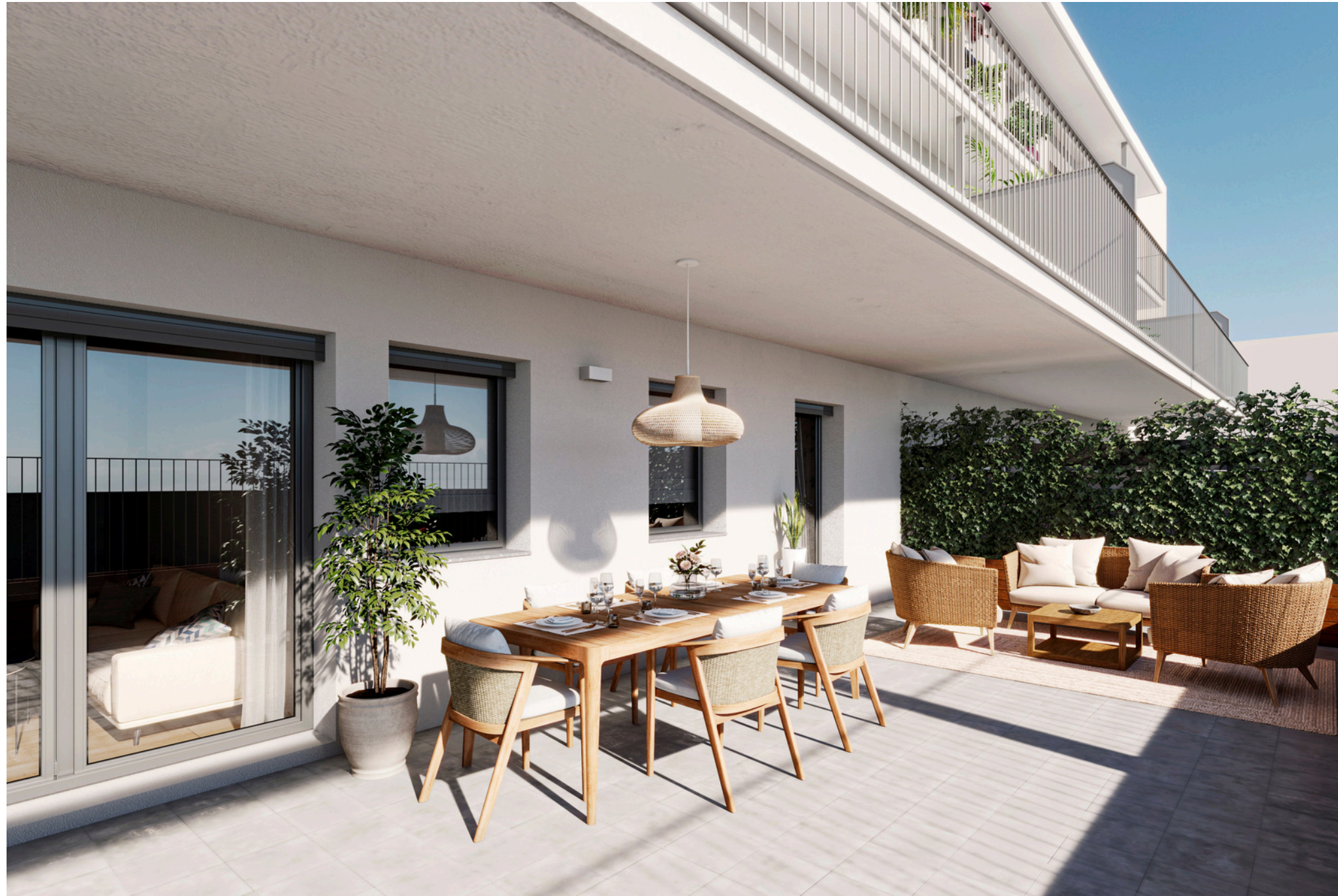
Terrassa planta baixa