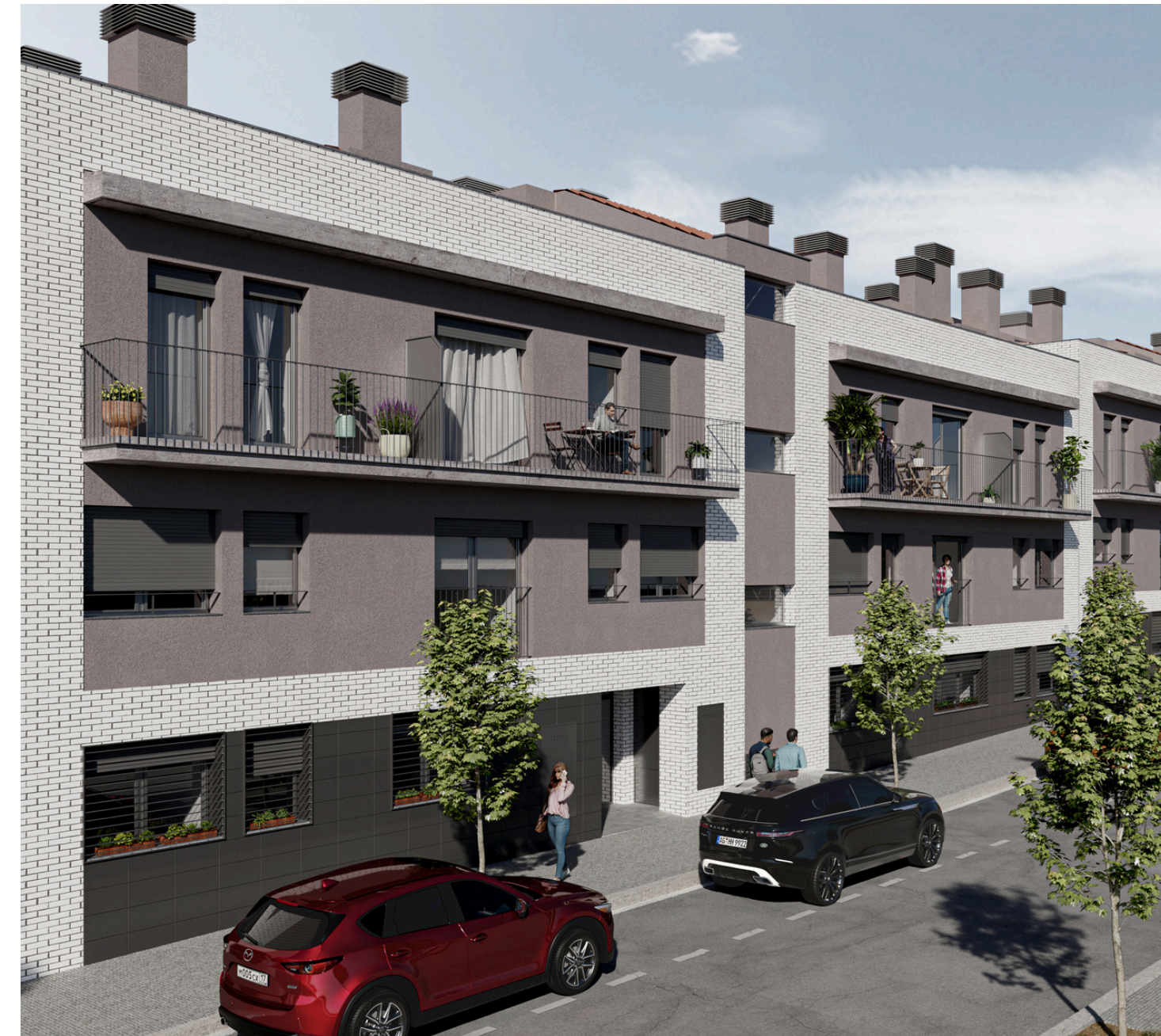
Façana carrer Puigsacalm

Puigsacalm és una promoció d'obra nova situada en el nucli urbà de Corró d'Avall, a Les Franqueses del Vallès, a un pas de l'Ajuntament i amb tots els serveis al seu voltant. Corró d'Avall, a més, compta amb una excel·lent comunicació tant amb cotxe com en transport públic amb Granollers, amb Barcelona i amb la resta de municipis adjacents.